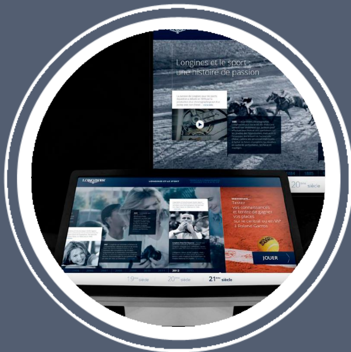
INTERACTION ET AIDE A LA VENTE