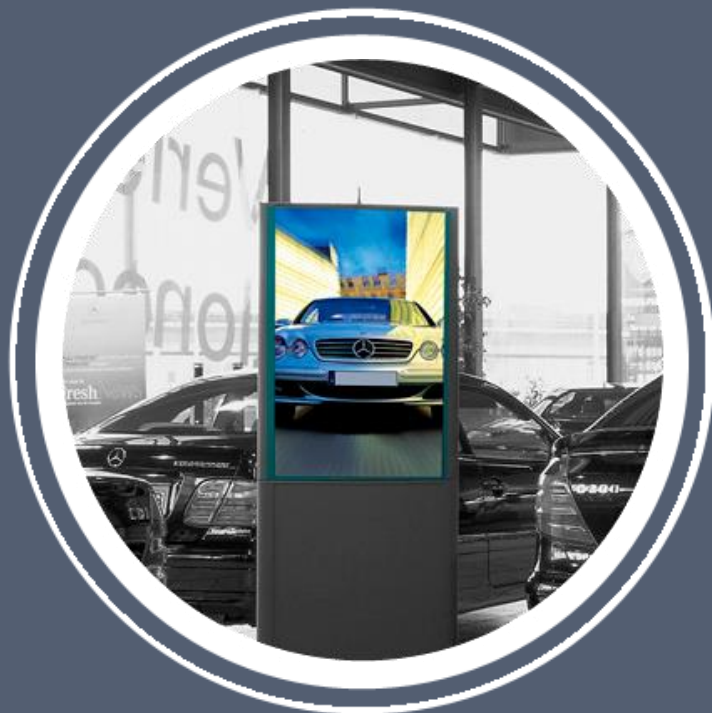
FICHE PRODUIT AUTO INTERACTIVE